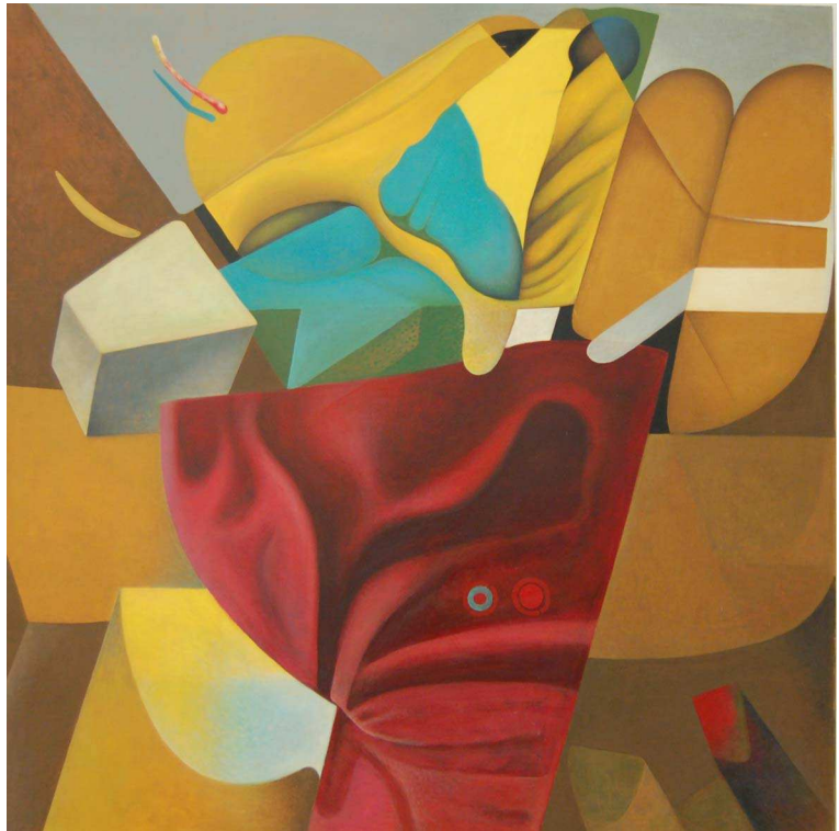
Inflorescence seconde , 1976-1982, huile sur pavatex, 120 x 120 cm