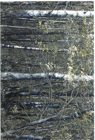
↑ Une peinture très réaliste d'Amedeo Baumgartner.

Le Musée jurassien des arts expose jusqu'au 26 mai deux artistes bernois, Bernd Nicolaisen et Amedeo Baumgartner. Leur point commun : tous deux portent un regard sur la nature, mais différemment. Par Mirosław Halaba / Journaliste