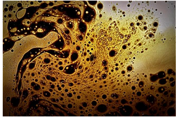
Thématique : pollution