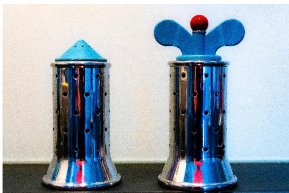
Thématique : industrie

Plus d'information sur le site internet : www.photoclubmoutier.club