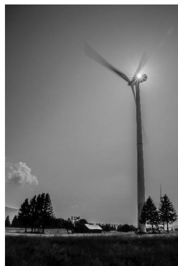
© Alexandra Schaffter Thématique : énergie