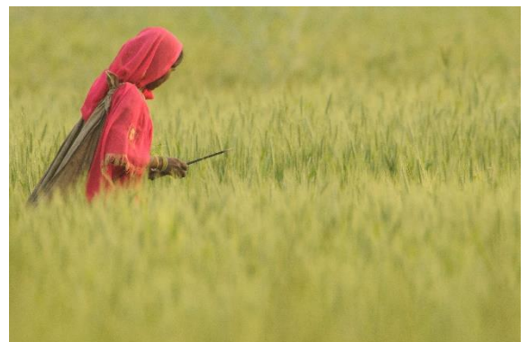
© Alain Saunier Thématique : agriculture