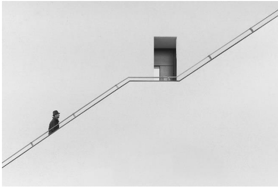
Thématique : urbanisme