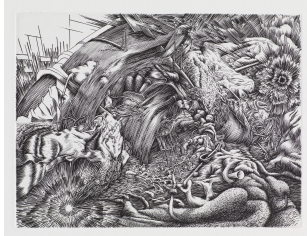
Markus Raetz (1941-2020), MR inv. & sculp , 1994-1995, burin, P.P., no. ex. 3/3, édition imprimée en 2011 à 33 exemplaires, 12x (43.5 x 33.5 cm)

Principe de l'atelier : comprendre la technique de la pointe sèche en expérimentant la gravure sur un matériau dur.