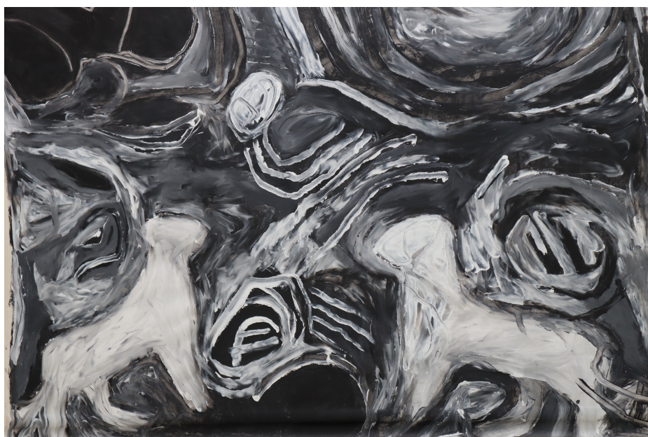
Exemple avec des animaux © Dani Jehle