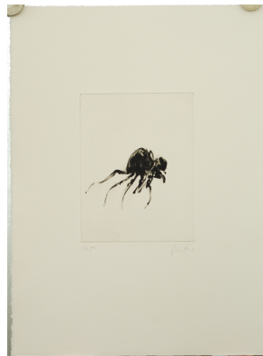
Martial Leiter (*1952), Sans titre , 2010, pointe sèche, P.P., 35.7 x 25.5 cm, 6x (38 x 27.5 cm)