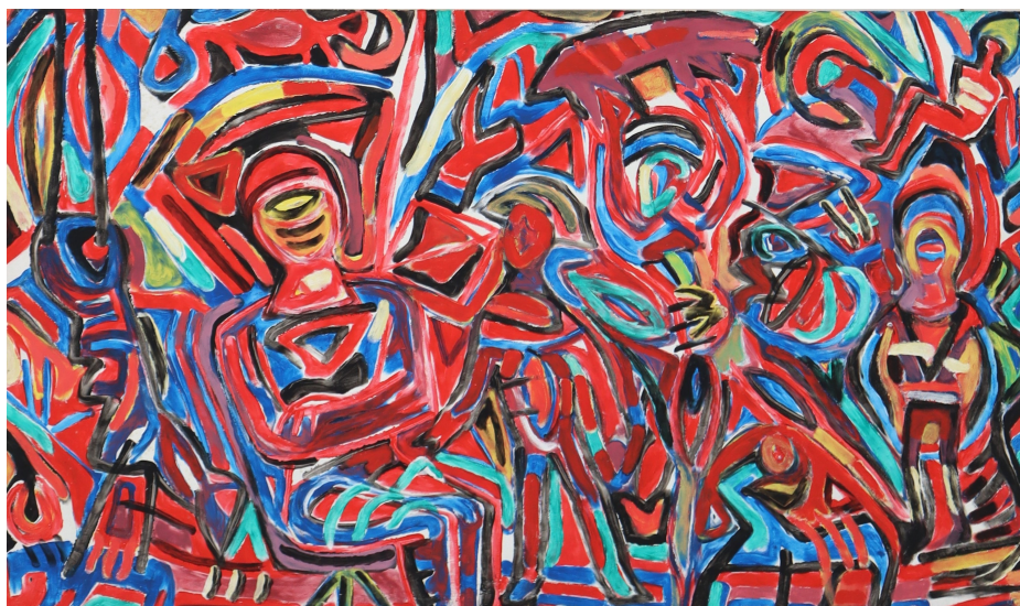
Exemple avec des figures humaines © Dani Jehle