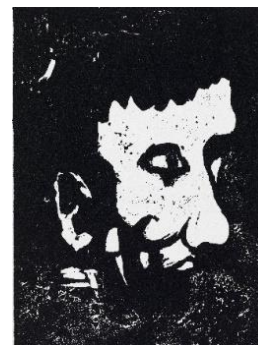
Mine de riens, 1968-1970, linogravure sur papier, coll. Musée de l'Hôtel-Dieu